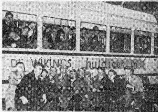
De dappere Vikings poseerd voor « hun » PCC

Na de traditionele foto met helverlichte P.C.C. en stralende studenten, die er een erehaag vormden, drumden de commillones de